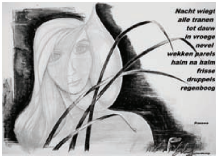
Cultuurweekend 2011 • Holsbeek in z'n blootje

Laat je onderdompelen in de soms bizarre kronkels in het hoofd van Gust en lees wat zijn werk in het gemoed van dichters losmaakt.